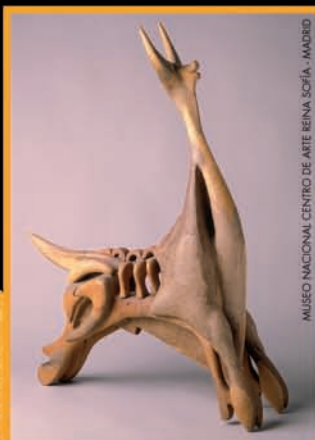
© Alberto Sánchez, VEGAP, Madrid, 2004. Toro, 1958-1960